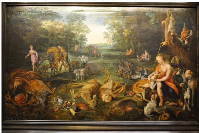
Brueghel et van Balen– La matière s'organise